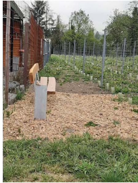
Die „Deichstadtwinzer“Fläche in Irlich im April 2020, mit Bank und demnächst mit Steele